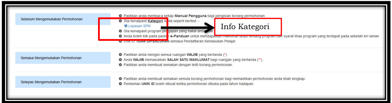
Rajah 1.3: Info Permohonan

1.10 Setelah berjaya Log Masuk, Tekan butang 'Permohonan' pada sebelah kiri laman untuk mula membuat permohonan.